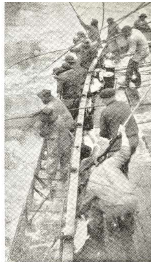
Aspecto movimentado da pesca com vara de salto

Das características gerais da família dos « scombridae », podemos dizer que são muito vorazes e peixes com um ciclo migratório que ainda não está completamente definido, embora